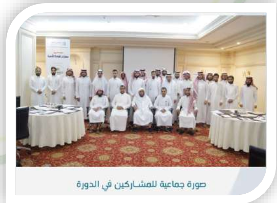
صورة جماعية للمشاركين في الدورة